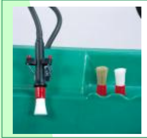
3 Pinceaux interchangeables