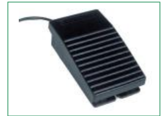
Commande au pied