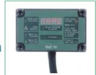
Ecran de contrôle déporté